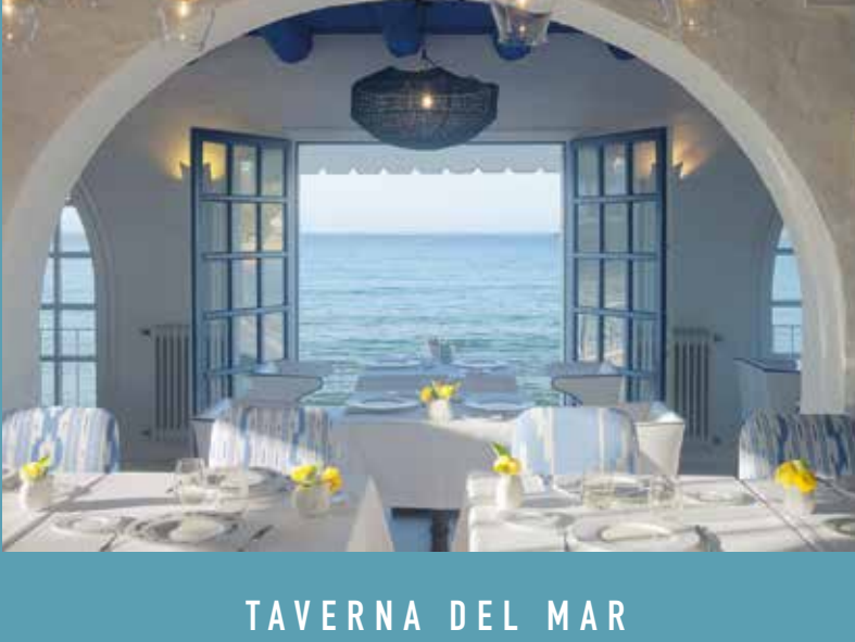
TAVERNA DEL MAR Le riz, les fruits de mer et les poissons frais