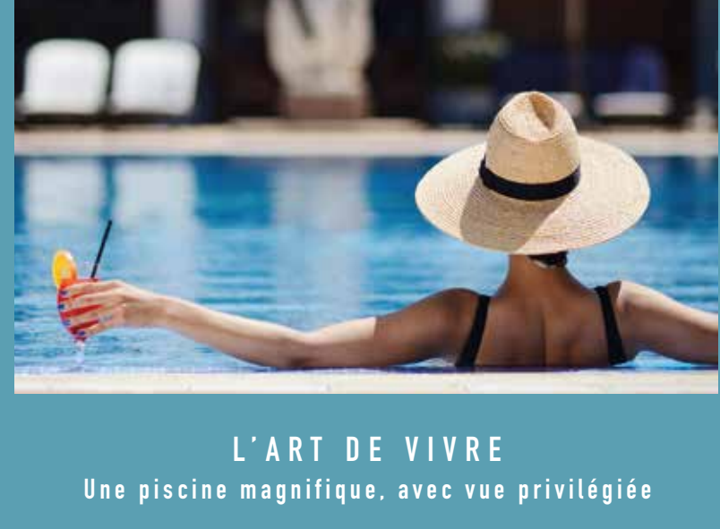
L'ART DE VIVRE Une piscine magnifique, avec vue privilégiée