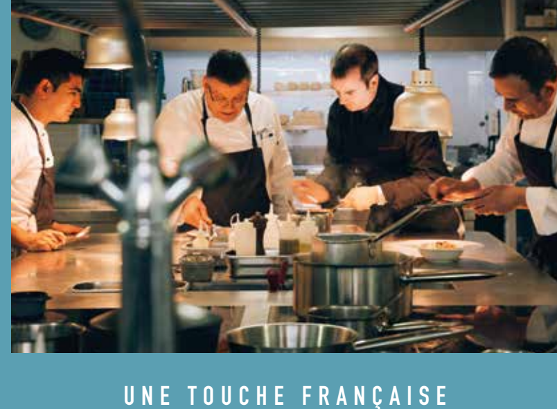
UNE TOUCHE FRANÇAISE Alliant tradition et modernité