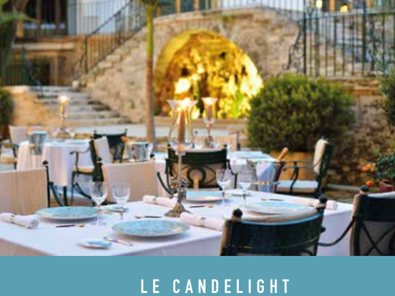
LE CANDELIGHT By Romain Fornell, étoilé au guide Michelin