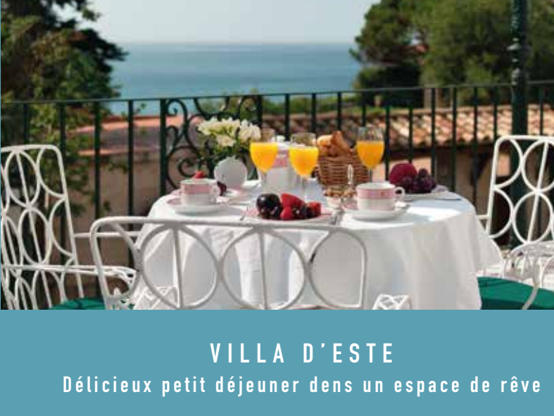
VILLA D'ESTE Délicieux petit déjeuner dans un espace de rêve

UN CADRE NATUREL UNIQUE Le lieu idéal pour ces vacances d'été