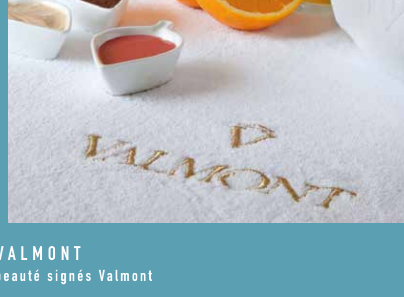
SPA BY VALMONT Soins et produits de beauté signés Valmont