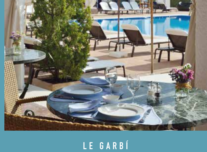
LE GARBÍ Restaurant méditerranéen au bord la piscine