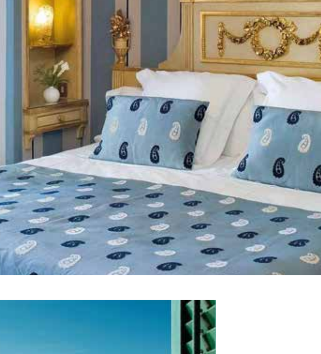
CHAMBRE SUPÉRIEURE VUE SUR MER