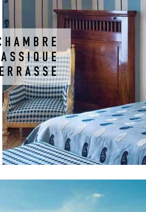
CHAMBRE CLASSIQUE AVEC TERRASSE